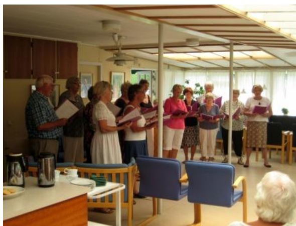
Åbent Hus koncert