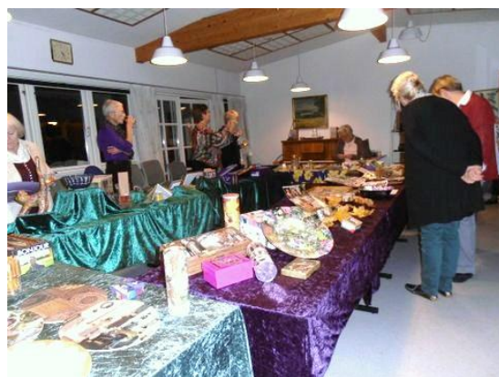
Udstilling af de færdige arbejder