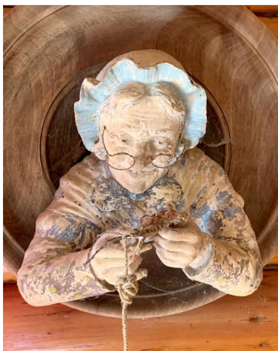
”Et kært minde fra Bjælkehytten”

Billedvævning er et håndværk, hvor man med garn kan skabe unikke billeder, som males med tråden. Alle kan være med, øvede som begyndere. Med billedvævning kan du fordybe dig, slappe af og få ro i krop og sjæl, men også nyde samværet og udveksling af ideer omkring vævningen. Undervisningen vil foregå samlet og individuelt. Du vil lære væveteknikker til brug i dit billede, så det vil få et levende og spændende udtryk. Der vil være 2 aftener med foredrag om vævningens historie, billedkomposition og inspiration. Materialepris: 300 kr. inkl. væveramme, gobelinpind, garn m.m. Betales på kurset.