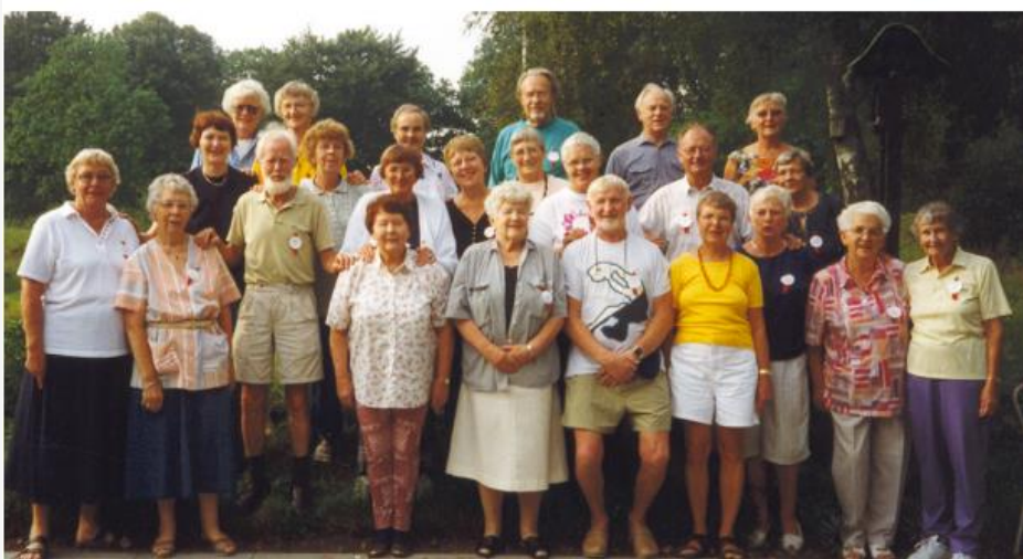
Årgangshold 97 samt holdledere og køkken personer.

Vi kom ind i 97 sammen med 17 andre, og vi fik i løbet af to uger instruktion i, hvordan vi skulle opføre os inklusive arbejdsopgaverne og deltagelse i underholdning. Vi måtte ikke forlade Storedam i de to uger! Vi slap godt igennem og syntes, vi var et godt hold, men i de følgende år faldt der flere fra. En fordi hendes datter syntes, det var synd hendes mor skulle gøre rent!!