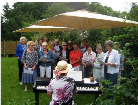
Koncert på Nina's Naturcafé