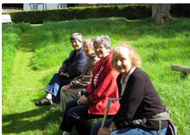
Der blev også tid til en tur rundt om søen