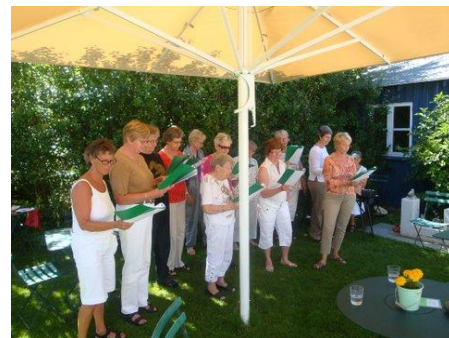
Optræden på Ninas Naturcafe