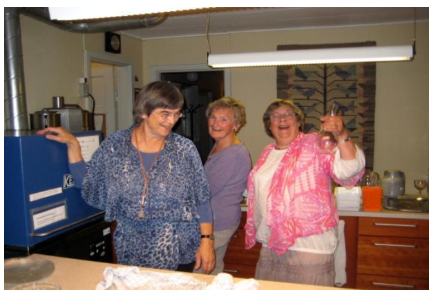
Højt humør på opvaskeholdet